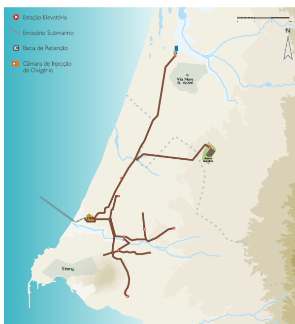
Figura I - Sistema de Água Residual de Santo André