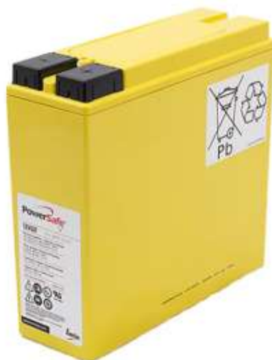
Imagem 1 - Baterias de chumbo do tipo PowerSafe de 12V 62Ah